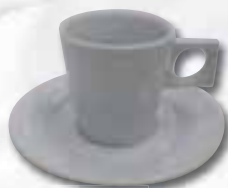
2 Tasse NYNY