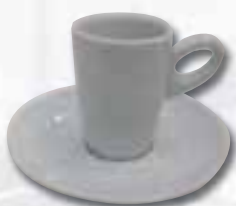
1 Tasse Alta