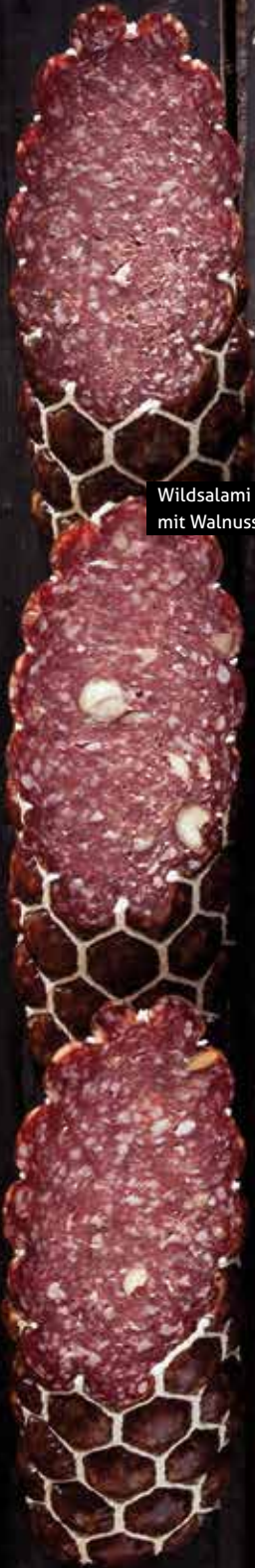
Wildsalami mittelfein mit Walnuss