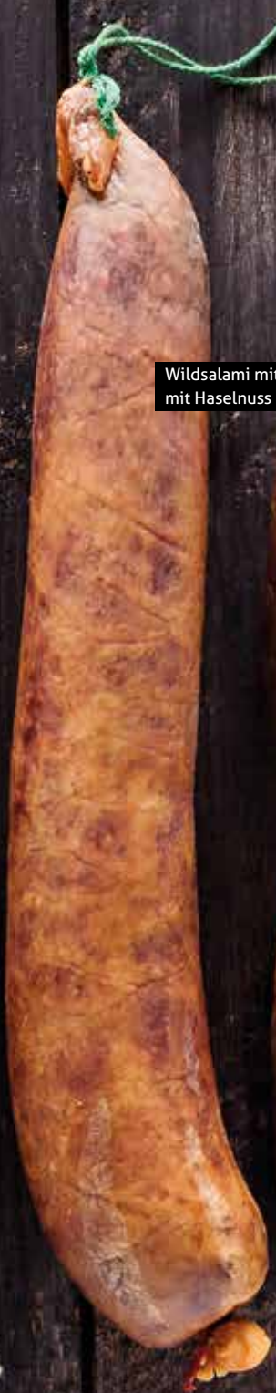
Wildsalami mittelfein mit Haselnuss